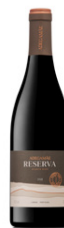
ADEGAMÃE RESERVA TINTO