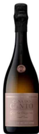
Espumante Grande Reserva Bruto