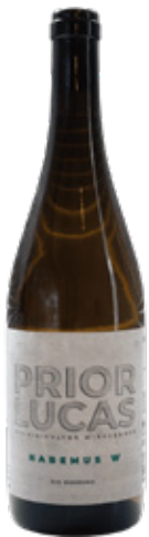
PRIOR LUCAS Habemos W BRANCO