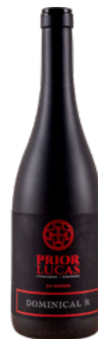
PRIOR LUCAS Dominical R TINTO

Sustentabilidade e inovação: cubas de betão produzidas localmente, energia renovável, aproveitamento de águas pluviais e práticas que protegem o solo e a biodiversidade. O projeto alia tradição, identidade e respeito pela terra.