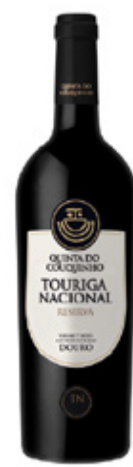
Grande Reserva TINTO