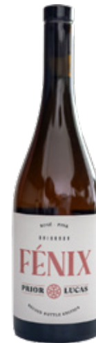
PRIOR LUCAS Fenix R TINTO