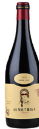
ALMOTRIGA Reserva TINTO