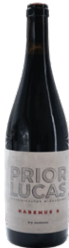
PRIOR LUCAS Habemos S TINTO