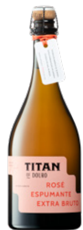
TITAN ESPUMANTE EXTRA BRUTO ROSÉ