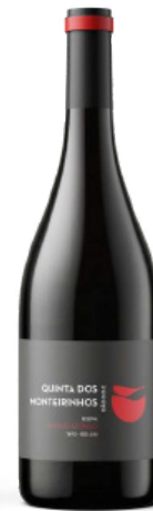
Menino Afonso Reserva TINTO