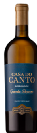
Grande Reserva BRANCO