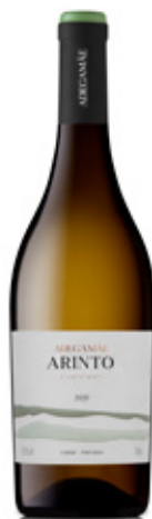
ADEGAMÃE ARINTO BRANCO