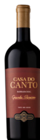
Grande Reserva TINTO