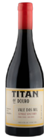
TITAN VALE DOS MIL TINTO