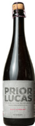
PRIOR LUCAS Baga Bubbles ESPUMANTE ROSÉ