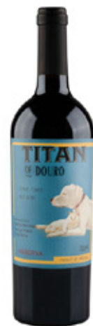
TITAN RESERVA TINTO