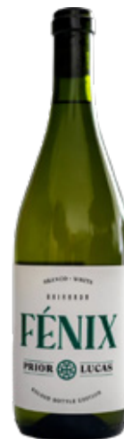
PRIOR LUCAS Fenix W BRANCO