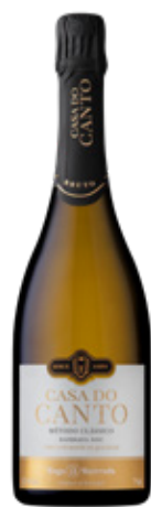
Espumante Baga Bairrada Bruto BRANCO