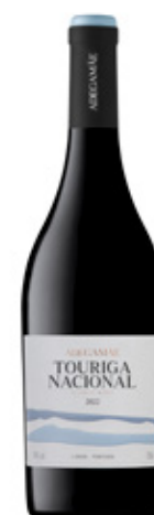
ADEGAMÃE TOURIGA NACIONAL TINTO