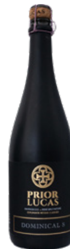
PRIOR LUCAS Dominical S ESPUMANTE