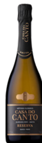
Espumante Reserva Bruto