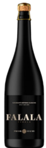
PRIOR LUCAS Falala Pérola ESPUMANTE