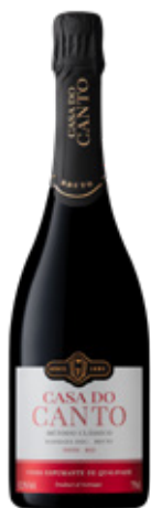
Espumante Bruto TINTO