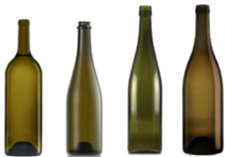
Bordalesa Borgonhesa Renana Espumante